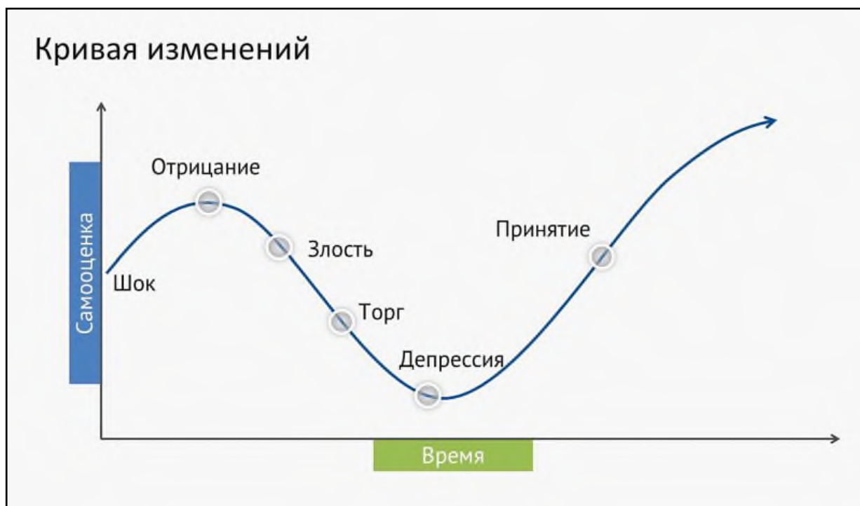
Рис. 1. Стадии переживания горя по Э. Кюблер-Росс

Считается, что нормальная реакция скорби может продолжаться до года. Это не значит, что человек может полностью восстановиться за это время и начать жить как ни в чем не бывало. Однако примерно за этот период проходят сильные реакции эмоционального реагирования на утрату, человек начинает потихоньку привыкать жить иначе и строить свою жизнь без умершего.